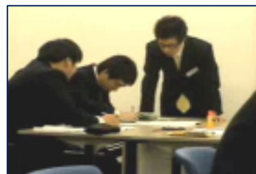
チームワークと役割分担も大切に。